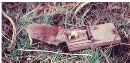
Mäuseprognose mit Schlagfallen

Mindestens 25, besser 50 Schlagfallen werden mit kernlosen weißen Rosinen (keine Korinthen → nicht attraktiv, keine fetthaltigen Köder → fangen zu viele Spitz- und Langschwanzmäuse!) beködert. Wie bei der Steckholz- methode werden diese entlang einer gedachten Linie, die den gefährdeten Jungwuchs durchquert, in vergrasteten Partien alle zwei Schritt ausgelegt. Nach 24h wird die Fallenlinie kontrolliert, gefangene Mäuse entnommen und die Fallen wieder aufgestellt. Nach weiteren 24h wird nochmals kontrolliert und die Fallen werden wieder eingesammelt. Die gefangenen Mäuse werden – nach Arten getrennt – protokolliert.