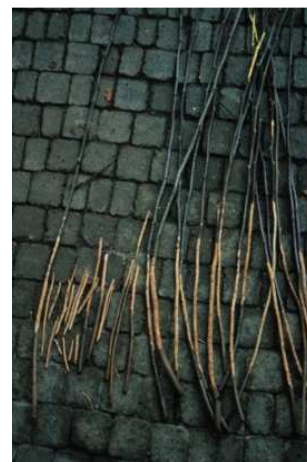
Apfel-Steckreiser nach 14 Tagen Standzeit in einer stark von Erdmäusen besiedelten Kultur (alle ursprünglich gleich lang!)

Die Steckholz methode ist selektiv nur für die vegetarisch lebenden Kurzschwanzmäuse, es gibt also keine Fehlanzeigen durch Nicht-Zielarten (sie lässt allerdings keine Artbestimmung zu), ist wetterunabhängig und zuverlässig. Gelegentlich werden die Steckreiser von Hasen, Kaninchen oder Schalenwild angenommen, hier ist die Differentialdiagnose aber leicht möglich.