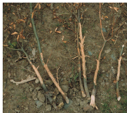
Buchen, von Erdmaus abgenagt und teilentrindet

Hauptschaden: Entmischung, aber auch Qualitätsminderung an den verbleibenden Bäumen durch den Fraß selbst und durch fraßbedingte Lücken in der Verjüngung. Linden und Erlen werden in Nordwestdeutschland von der Erdmaus in der Regel verschmägt. Massenvermehrungen mit hohen, große Schäden verursachenden Populationsdichten (bis ca. 100 - 300 Tiere/ha), unregelmäßig alle 2-4 Jahre.