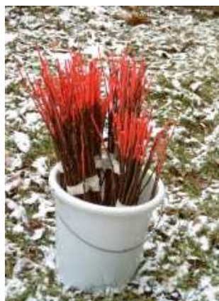
Zum leichteren Wiederfinden mit gefärbten Spitzen versehene Apfel-Steckreiser

Frühestens Ende des Sommers, September bis März, werden entlang einer durch die Jungwuchsfläche laufenden gedachten Linie in den vergrasteten Partien mit jeweils zwei Schritten Abstand zueinander mindestens 50 frisch geschnittene Apfel-Wasserreiser (ca. 50cm lang) senkrecht in den Boden gesteckt (ca. 10 cm tief). Nach 1 Woche werden diese auf Nageschäden untersucht. Wenn bereits nach dieser Zeit 20% oder mehr der Reiser benagt sind, wird eine Bekämpfungsnotwendigkeit angenommen. Finden sich noch kaum oder keine Nagespuren, wird nach einer weiteren Woche