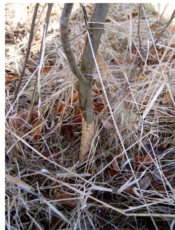
Frischer Erd-, Rötel- oder Feldmausschaden (an Nagespuren nicht zu unterscheiden!)

Wenn die Bäumchen stehend in größerer Höhe, ohne Steighilfen wie Ästchen oder Schnee, befallen wurden, war mit großer Wahrscheinlichkeit die Rötelmaus der Verursacher (Achtung: auch Eichhörnchen und Schlafmäuse nagen in größerer Höhe, aber i.d.R. mit charakteristischem Fraßbild → Fenster, Spiralen). Wenn die Bäumchen oberirdisch gefällt wurden, war es meist die Erdmaus (s.o.) und wenn unterirdisch die Wurzeln fehlen, kommen neben der Schermaus auch Rötel- und Feldmaus als Verursacher infrage (siehe dort).